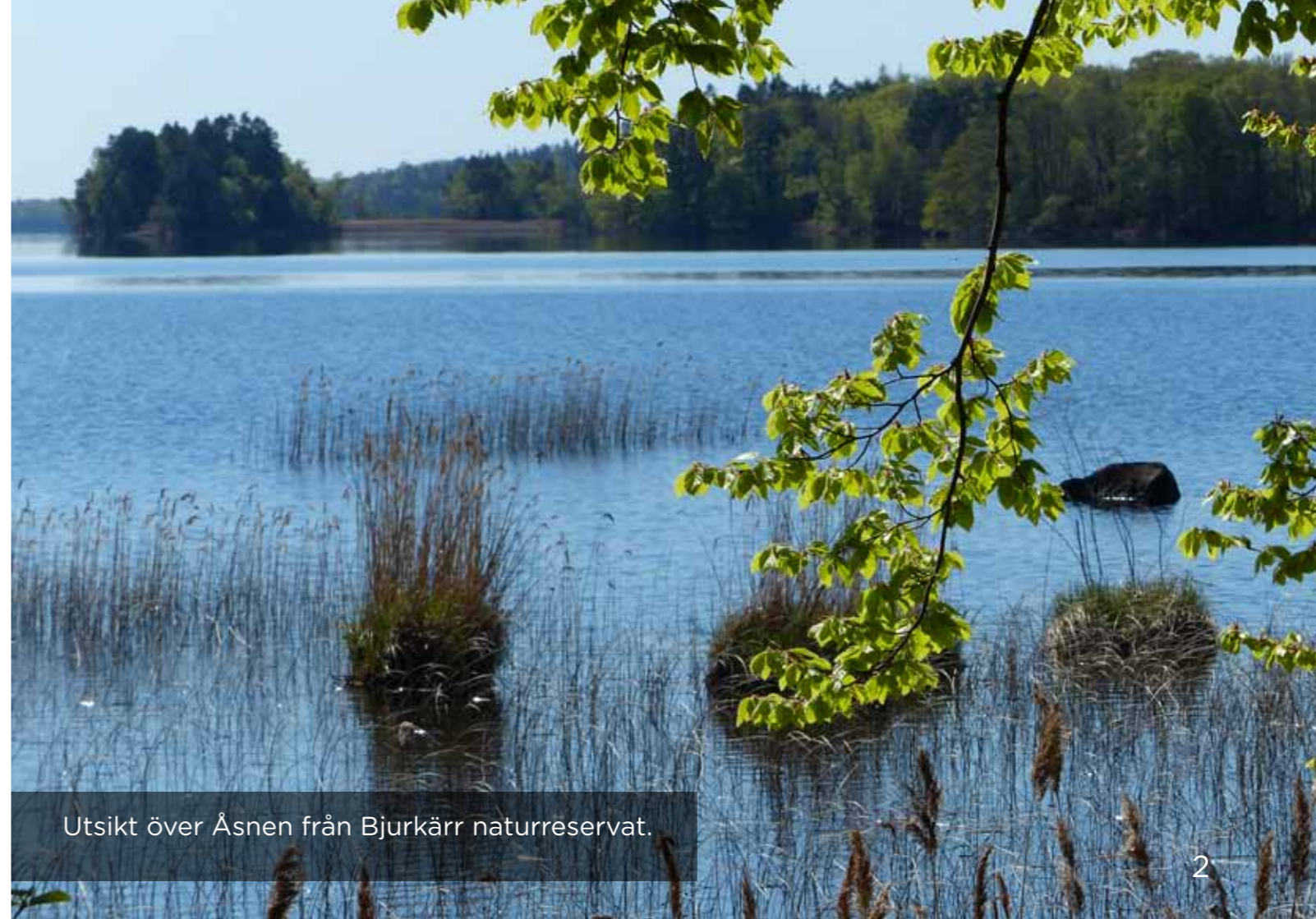
Utsikt över Åsnen från Bjurkärr naturreservat.

Det här är det tredje nyhetsbrevet med anledning av att det pågår utredning om att bilda en nationalpark i Åsnenområdet. Nyhetsbrevet sänds bl.a. ut till närboende runt hela sjön. Syftet är att sprida information om området och vad som sker i projektet. Nyhetsbrevet ges ut av Naturvårdsverket och Länsstyrelsen i samarbete med de tre kommunerna Tingsryd, Alvesta och Växjö.