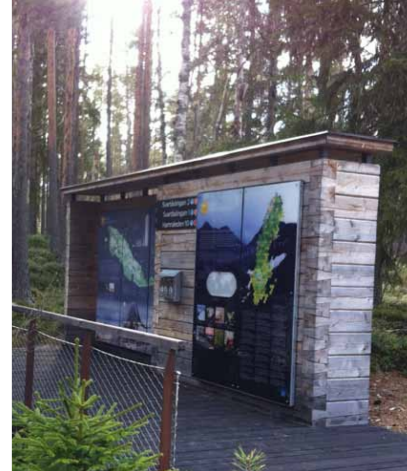
Exempel på nationalparksskylt från Hamra nationalpark i Dalarna.

På bägge entréerna ska det finnas en utomhusutställning där man kan lära sig mer om natur och kultur. Arkitekten ska också ta fram förslag på utformning av parkeringsplats, toalettbyggnad, sopsortering, rastplats, kanotupptagningsplats, m.m. som kan användas även på övriga besöksplatser inom nationalparken. Det finns kartförslag till hur entréerna skulle kunna planeras. Det finns också förslag till byggnader. Detta finns på hemsidan under fliken "Projektet".