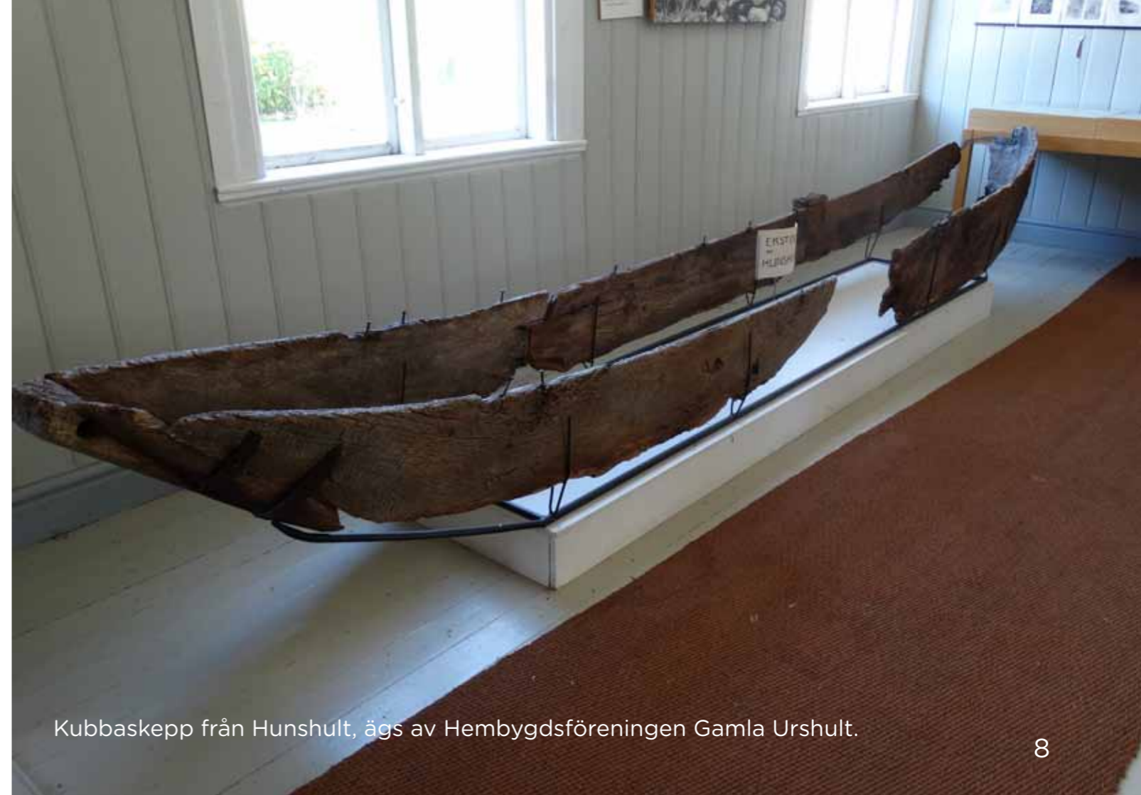
Kubbaskepp från Hunshult, ägs av Hembygdsföreningen Gamla Urshult.