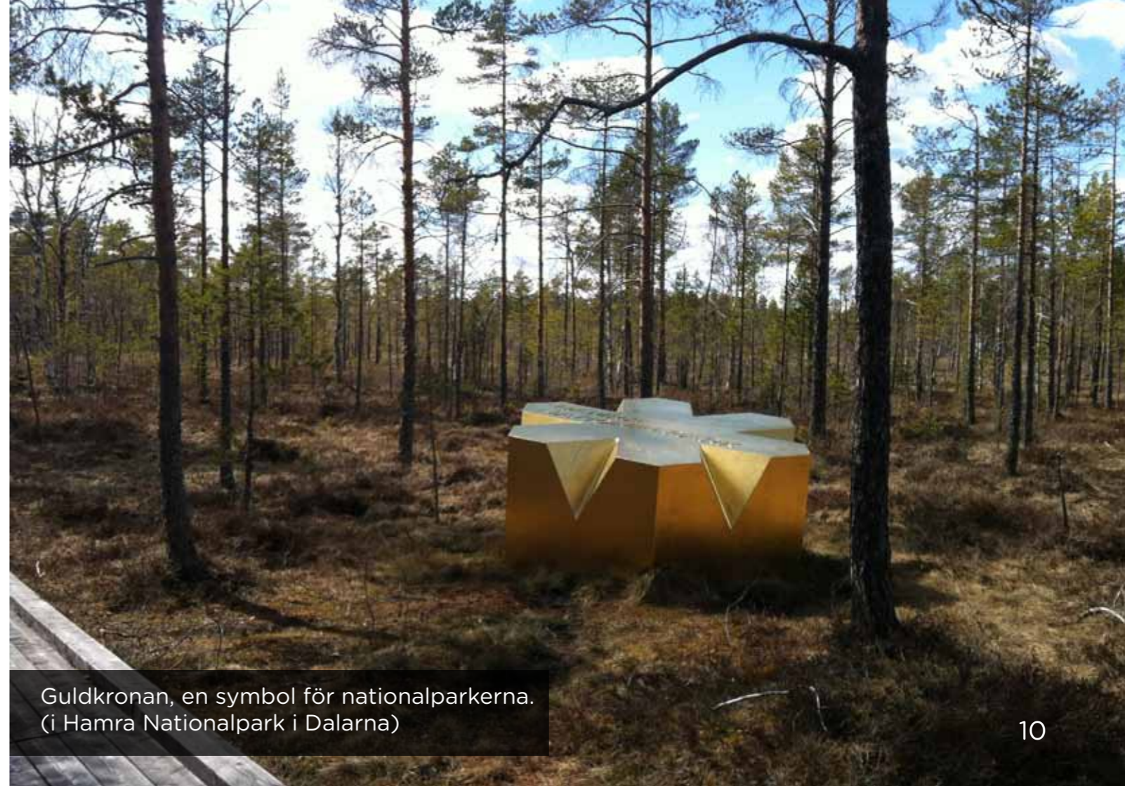
Guldkronan, en symbol för nationalparkerna. (i Hamra Nationalpark i Dalarna)

Föreskrifterna handlar även om ordningen i nationalparken, det gäller t.ex. att man inte får skada naturen, störa växt- och djurlivet eller andra besökare. Föreskrifterna reglerar också hur och var man ska få elda, tälta, jaga m.m. Förslaget finns att se på projektets hemsida under fliken ”Projektet”. På hemsidan kan du också se vilka föreskrifter som gäller idag inom de 5 befintliga naturreservaten. Framför gärna synpunkter på förslaget till oss som jobbar i projektet (se sidan 14).