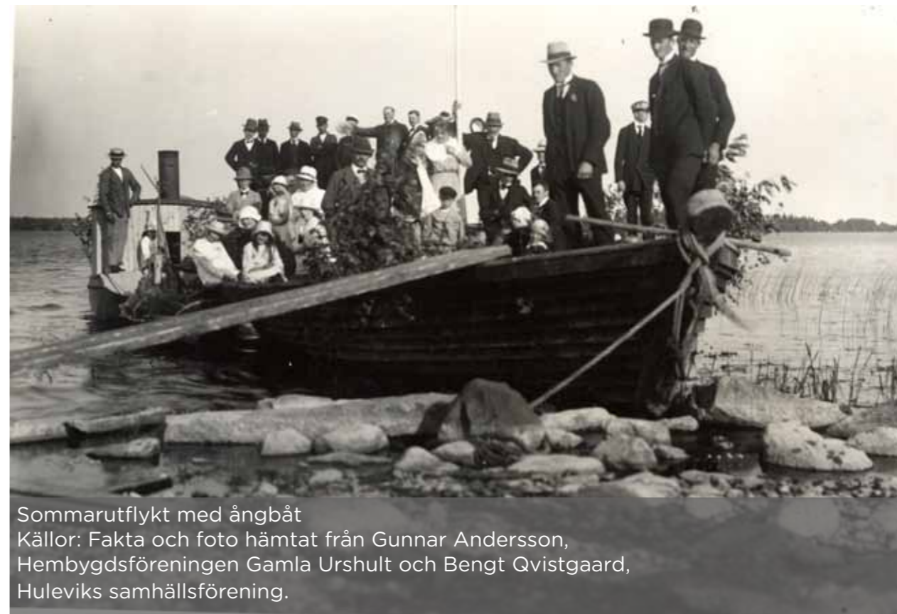
Sommarutflykt med ångbåt Källor: Fakta och foto hämtat från Gunnar Andersson, Hembygdsföreningen Gamla Urshult och Bengt Qvistgaard, Huleviks samhällsförening.

Under 1880-talet byggdes även järnväg på östra sidan av Åsnen och efter hand minskade efterfrågan på sjötransporter.